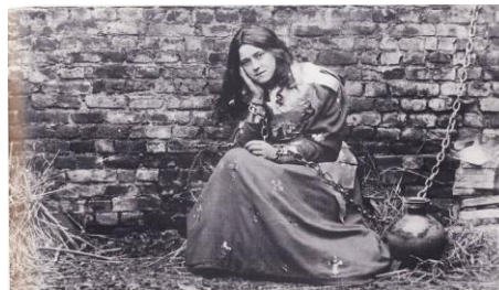
Počas rekreácie, začiatkom 1895. Terézia hrá postavu svätej Jany z Arku vo väzeni

Vyzerá to ako veľmi vyvážený denný program! Rád by som vám dal za domácu úlohu, individuálne alebo spoločne, urobiť podobný výpočet času a graf! Možno nás Pán volá k väčšiemu osobnému času na oddych a rekreáciu, aby sme mohli dať svetu a taktiež mladým ľuďom svedectvo o uvoľnenejšej komunite.